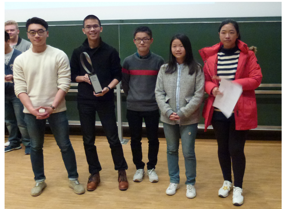
Sieger im Gruppenwettbewerb: Kolleg St. Blasien, Team 1 3. Platz im Gruppenwettbewerb: Gymnasium Überlingen, Team 1