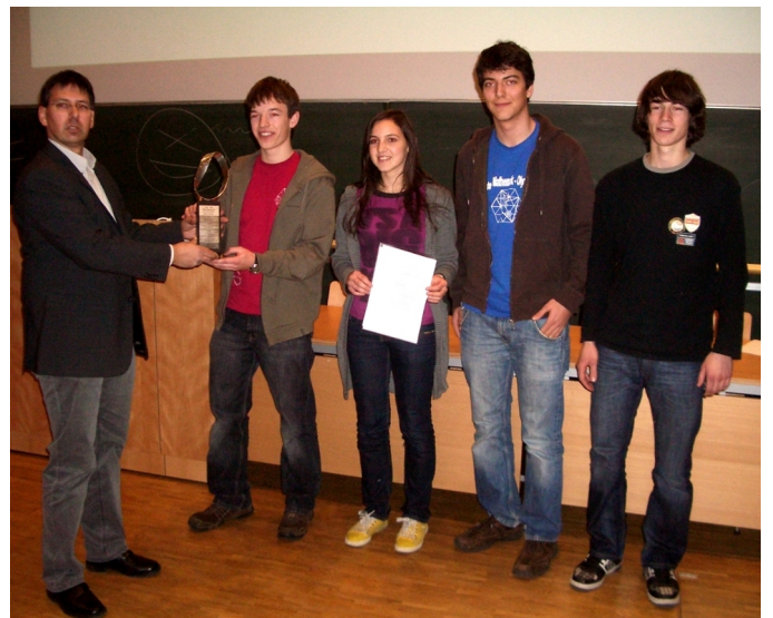
Sieger im Gruppenwettbewerb: BRG/BORG Feldkirch (Team 1)